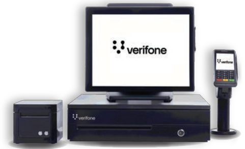
כוללת מסך MX9801